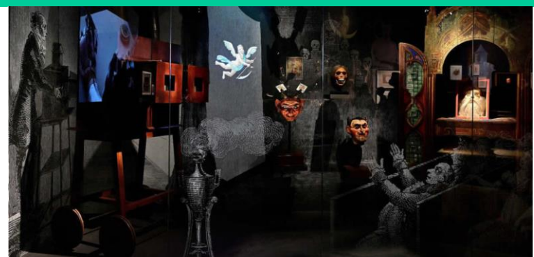
UN NOËL MAGIQUE AU MUSÉE MÉLIÈS DU 21 DÉCEMBRE 2024 AU 5 JANVIER 2025

Du 21 décembre 2024 au 5 janvier 2025, chaque après-midi, des magiciens accompagnent les visiteurs dans le Musée Méliès, et leur proposent des démonstrations et des ateliers de magie close-up. Tous les samedis matin des vacances scolaires, à 10h, sur réservation, les enfants de 7 à 12 ans, accompagnés d'un seul adulte, peuvent participer à un escape game, Le secret du professeur Barbenfouillis : ils doivent mener l'enquête pour retrouver la bague de la princesse Azurine.